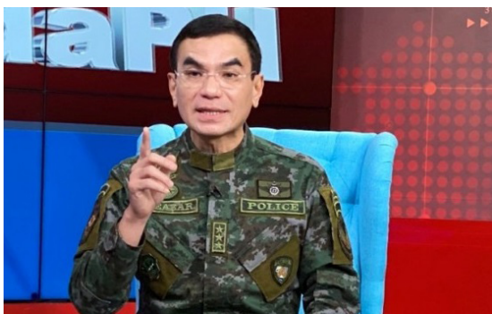
El jefe de la PNP, el general Eleazar, elogia a la policía por la muerte de cinco civiles.

El profesor Sison reveló que Duterte “aún no ha descartado por completo la opción de suprimir las elecciones de 2022”. Dijo que el pueblo filipino debe ser llamado a estar vigilante y militante contra la posibilidad de que Duterte “utilice actos terroristas de su cosecha propia o la pandemia como pretexto para declarar una ley marcial en todo el país o un gobierno presidencial pseudo-revolucionario, posponer las elecciones indefinidamente y gobernar por decreto como hizo Marcos en 1972.” UP