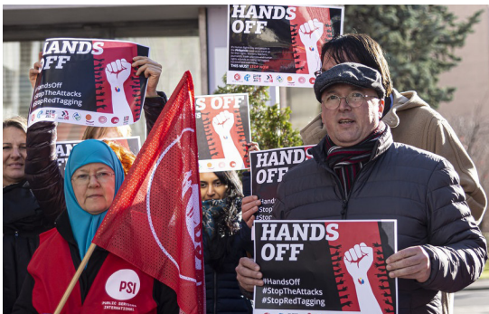
Funcionarios de IndustriALL Global Union protestan contra la creciente represión en Filipinas.

Entonces, nuestras esperanzas de una paz justa y duradera deben descansar en unirnos en mayor número, afrontar mayores desafíos y sacrificios y luchar con más determinación para ver el fin del régimen tiránico.